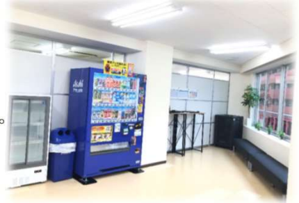
〈 評判の良い休憩室 〉